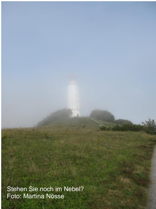
Stehen Sie noch im Nebel?