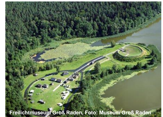
Freilichtmuseum Groß Raden, Foto: Museum Groß Raden

sowie Möglichkeit des Besuchs des DDR-Museums im Feriendorf Storchennest