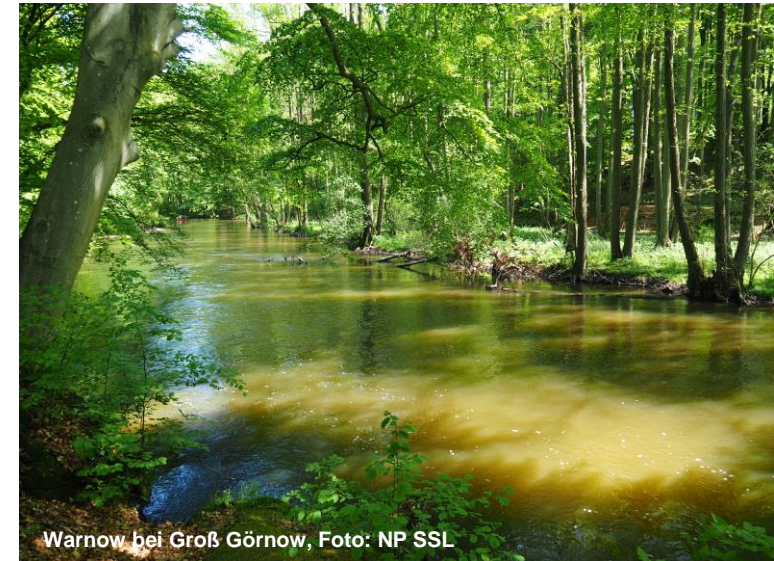
Warnow bei Groß Görnow, Foto: NP SSL

05.04. bis 07.04.2024 Naturpark Sternberger Seenland