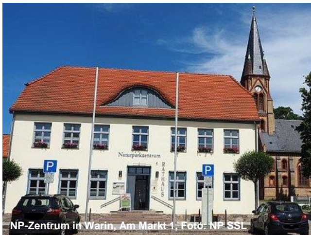
NP-Zentrum in Warin, Am Markt 1