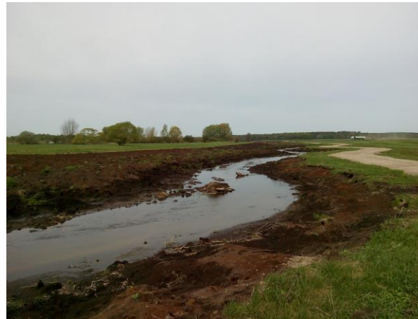
Recknitz bei Liessow 2015