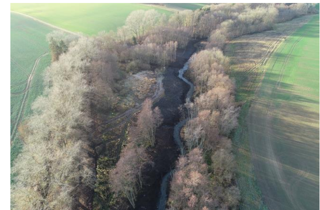
Strehlower Bach 2018

14.30 Uhr Ziele und Lösungsansätze der gemeinsamen Planung eines Altarmanschlusses mit Moor- vernässung StALU VP