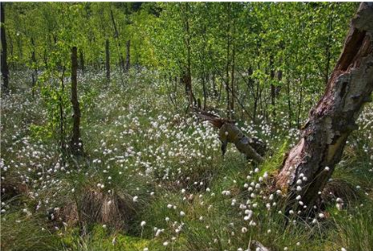
Wiedervernässtes Kesselmoor im NSG Plauer Stadtwald

Zur Verpflegung vor Ort erhalten die angemeldeten Teilnehmer*innen etwa eine Woche vor dem Termin - nach dem Anmeldeschluss 27. Mai 2025 – eine Nachricht per Mail.